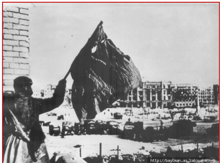
Флаг над освобожденным городом.

Победа советских войск в Сталинградской битве является крупнейшим военно-политическим событием в ходе Второй мировой войны. Великая битва, закончившаяся окружением, разгромом и пленением отборной вражеской группировки, внесла огромный вклад в достижение коренного перелома в ходе Великой Отечественной войны и оказала определяющее влияние на дальнейший ход всей Второй мировой войны. Победа далась дорогой ценой. Например, под Сталинградом сражалась 231-я стрелковая дивизия, сформированная в Кунгуре, из 15 тысяч воинов, ушедших на войну, в живых осталось 600 человек.